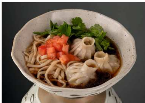
Утиный бульон с гедзами 450 гр | 480 утиный бульон, удон, гедзе с курицей, томат, кинза, зеленый лук, кунжут