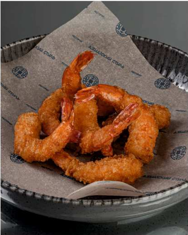
Хрустящие тигровые креветки 120 гр / 7 шт | 760