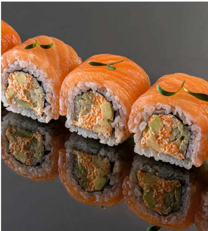
Нежность лосось, икра масаго, авокадо, огурец, сливочный сыр