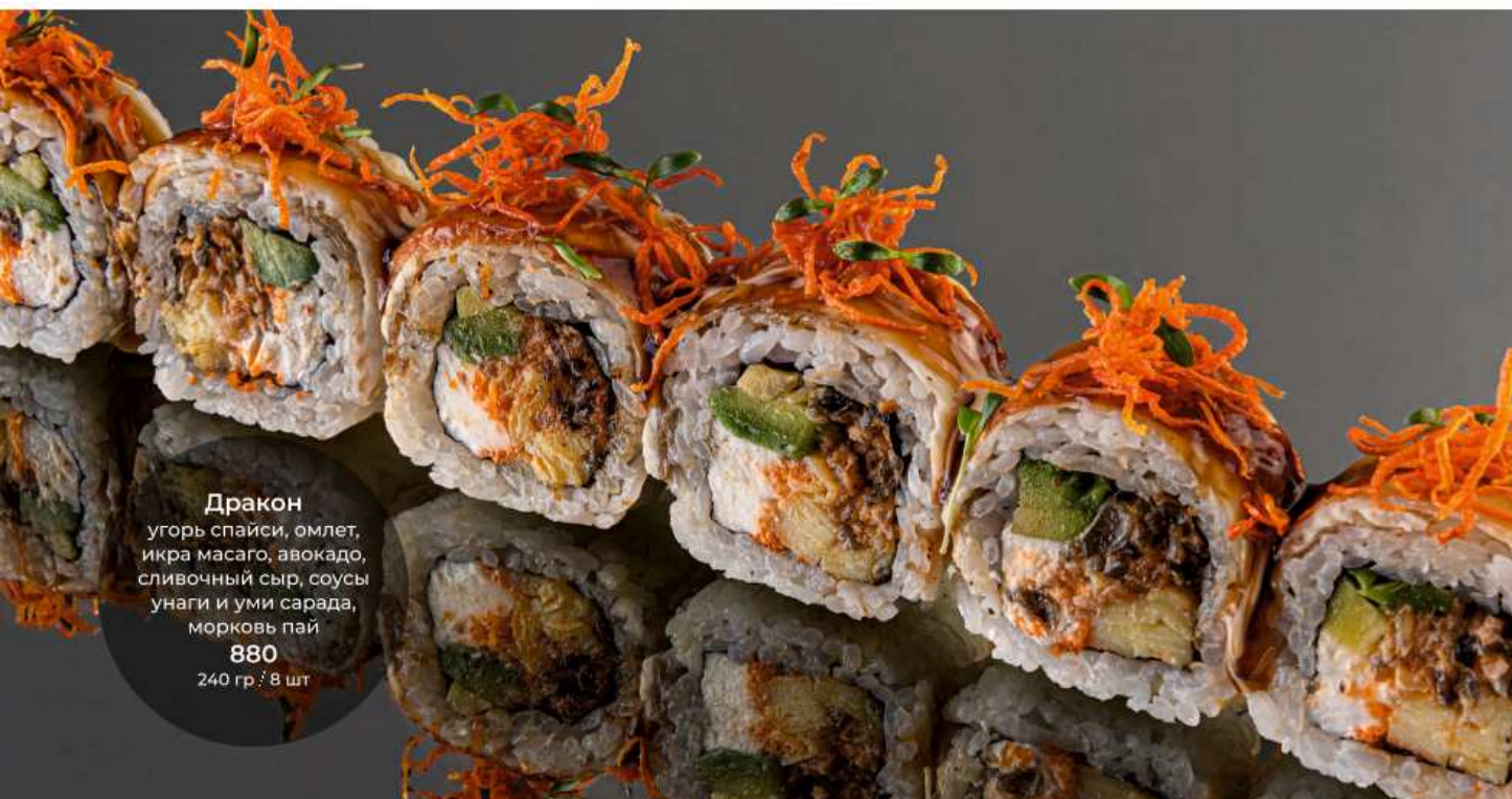
Дракон угорь спайси, омлет, икра масаго, авокадо, сливочный сыр, соусы унаги и уми сарада, морковь пай 880 240 гр / 8 шт

СПЕЦИИ | Имбирь - 50 | Васаби - 30 | Соевый соус - 40 | Соус понзу - 50