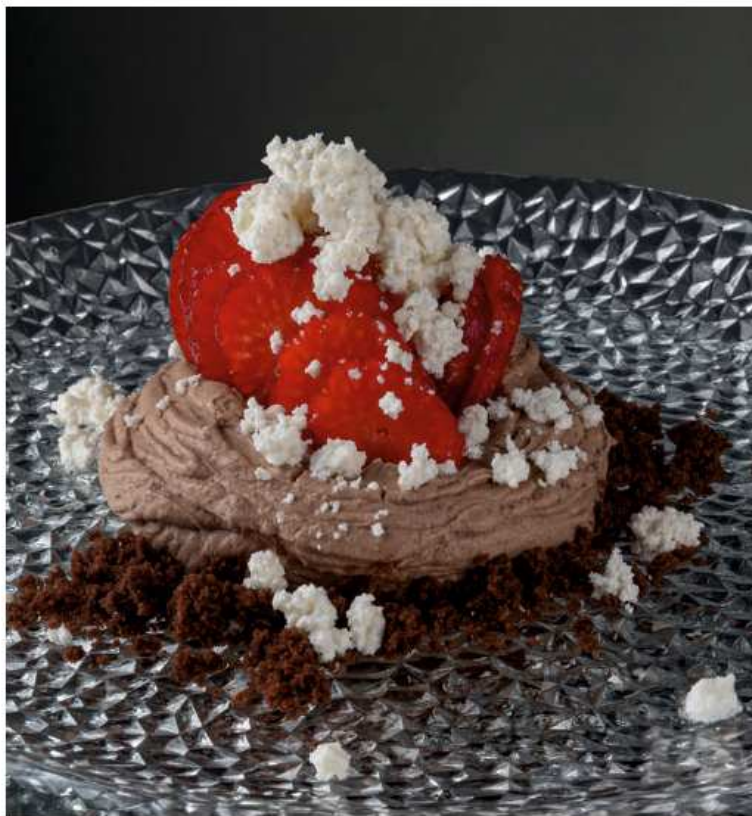
Шоколадный крем с клубникой и сыром «Фета»