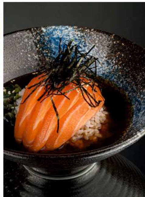
Сяке-суп 310 гр | 750 бульон на основе соевого соуса и хондаши, рис, лосось, кунжут, нори