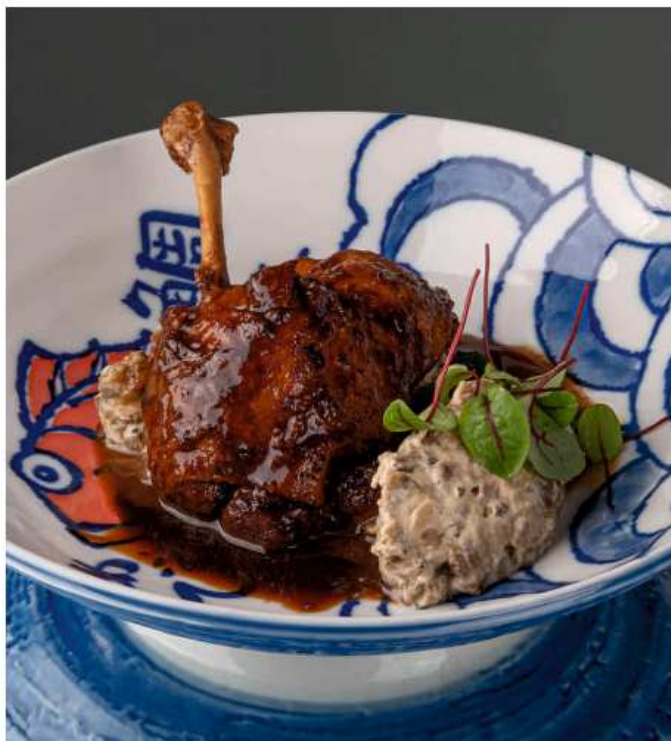
Утка конфи в соусе хойсин утиная ножка, пюре из баклажана, с соусами демигласс и сливовый