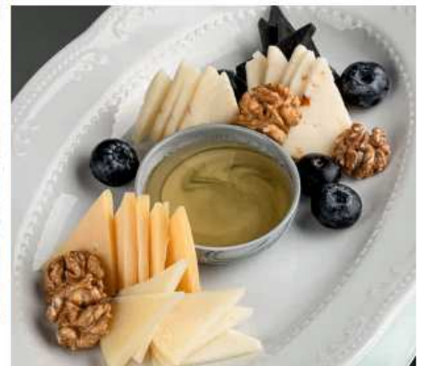
Сырное ассорти 125/30 гр | 590 сыры: качотта классич, черная, с паприкой, с пажитником, монтазио, мед, ягодный соус