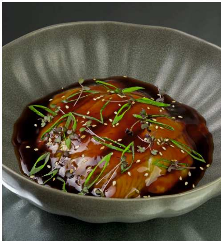
Копченый угорь с сырно-картофельным пюре