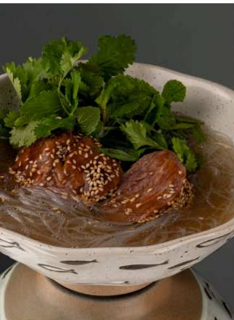
Говяжий бульон с щековиной 310 гр | 760 говяжий бульон, телячья щековина, фунчоза, имбирь, кинза, кунжут, зеленый лук