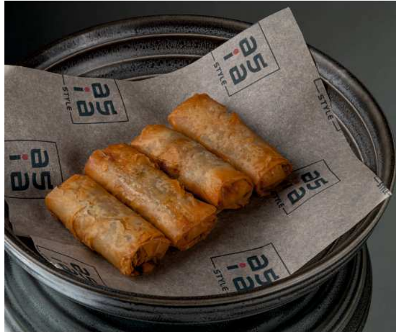
Пирожки с бараниной 120 гр / 3 шт | 430 Пирожки фило с морепродуктами 140 гр / 4 шт | 430 Пирожки фило с курицей и грибами 120 гр / 4 шт | 430