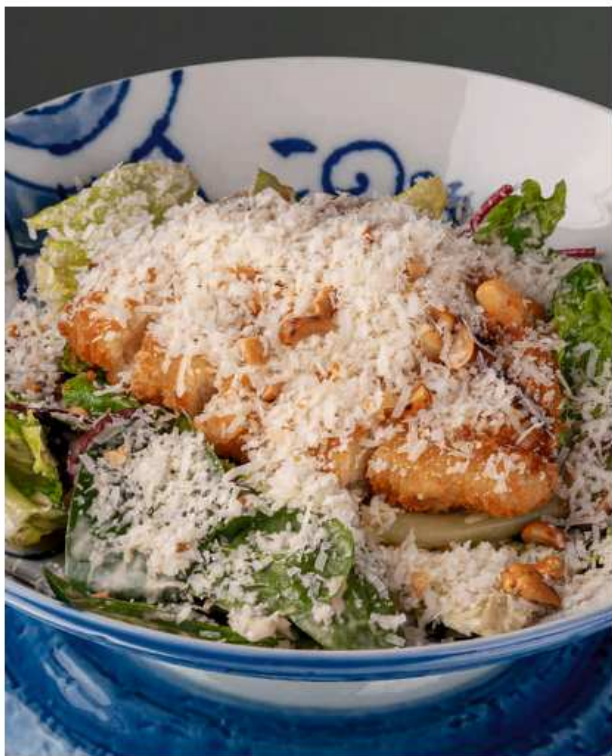
Салат с цыпленком кацу 190 гр | 620 куриное филе в панировке, микс салатных листьев, арахис, соус поке, домашний майонез