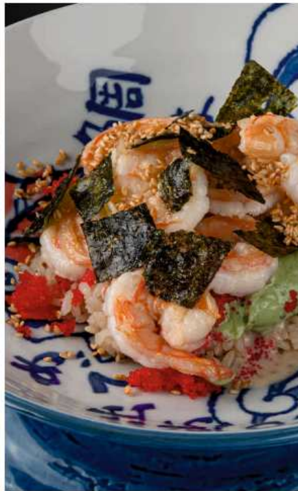
Поке с креветкой 220 гр | 750 тобико, кунжут, рис, гуакамолле, кунжутный соус