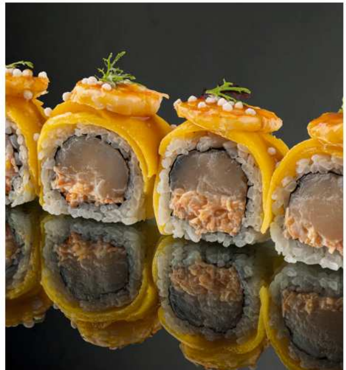
Ролл с красной креветкой и манго 190 гр / 4 шт | 930 гребешок, креветки, манго, икра масаго, соус на основе пюре манго и чили, соус милк той