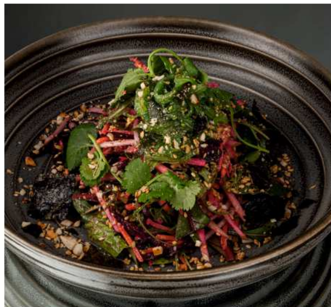
Салат «Ясай Сарада» 160 гр | 490 микс салатных листьев, яблоко, морковь, свекла, кайса, арахис, кунжут, кинза, ореховый соус, заправка на основе оливкового масла и дижонской горчицы