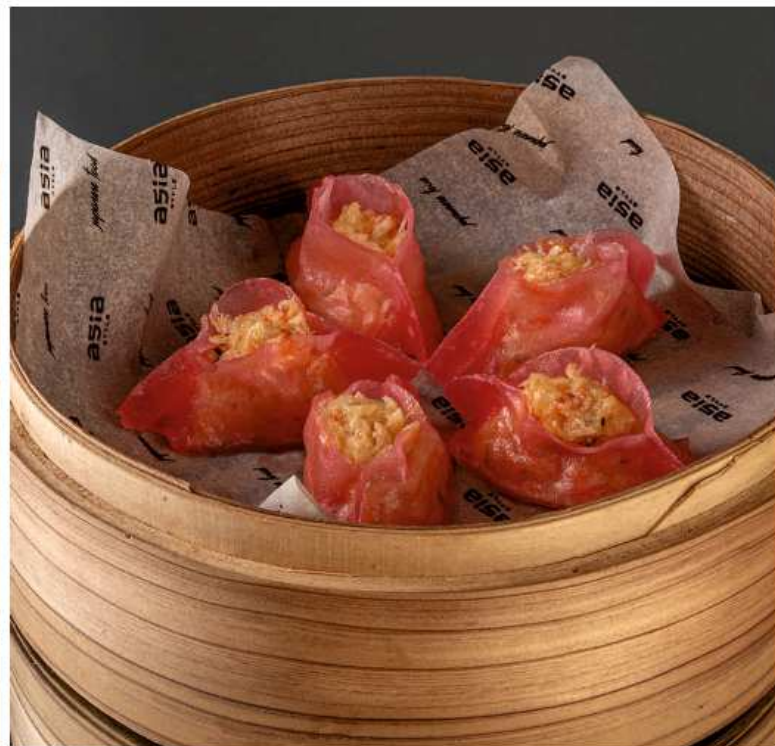
Дим-самы с крабом 145 гр / 5 шт 680