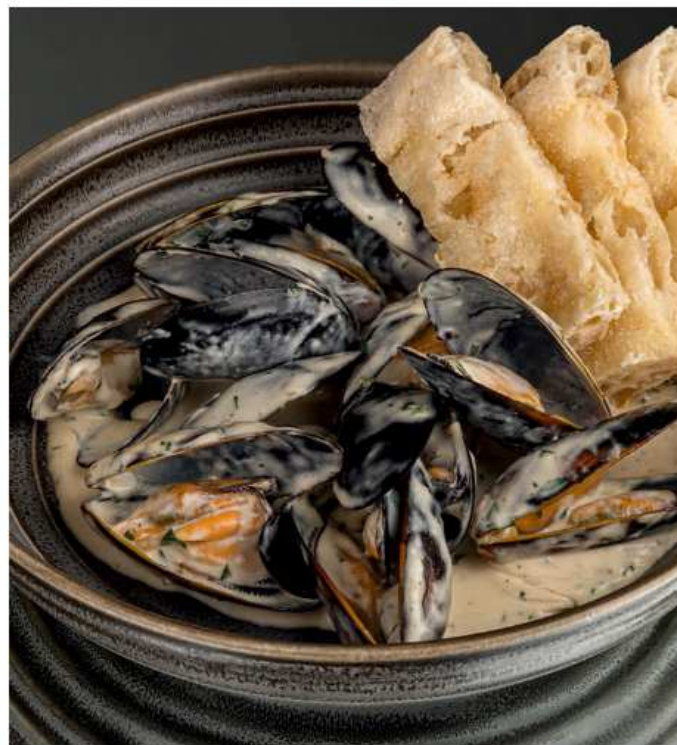
Мидии в сливочном соусе с чесноком мидии в ракушках, сливочный соус, чеснок, петрушка, пармезан, лепешка фокаччо