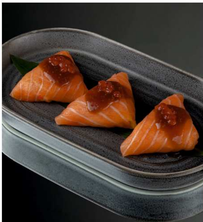
Умай Икура 120 гр / 3 шт | 800 лосось, икра лосося, манго, калифорнийская смесь, соусы унаги и сливочный васаби