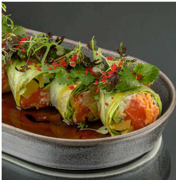
Хеппи-лайт с креветкой и лососем 180 гр / 6 шт | 850 лосось, креветки, омлет, икра масаго, огурец, авокадо, лист салата, имбирь маринованный, соусы на основе манго с чили перцем и цитрусовый, кинза, мята