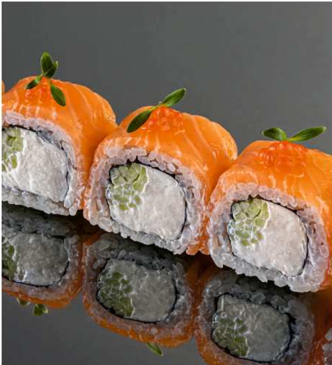
Филадельфия икра 260 гр / 6 шт | 1150 лосось, икра лосося, огурец, сливочный сыр