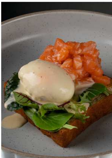
Бенедикт с лососем, 250 гр | 1100 соусом голландез и миксом салатных листьев