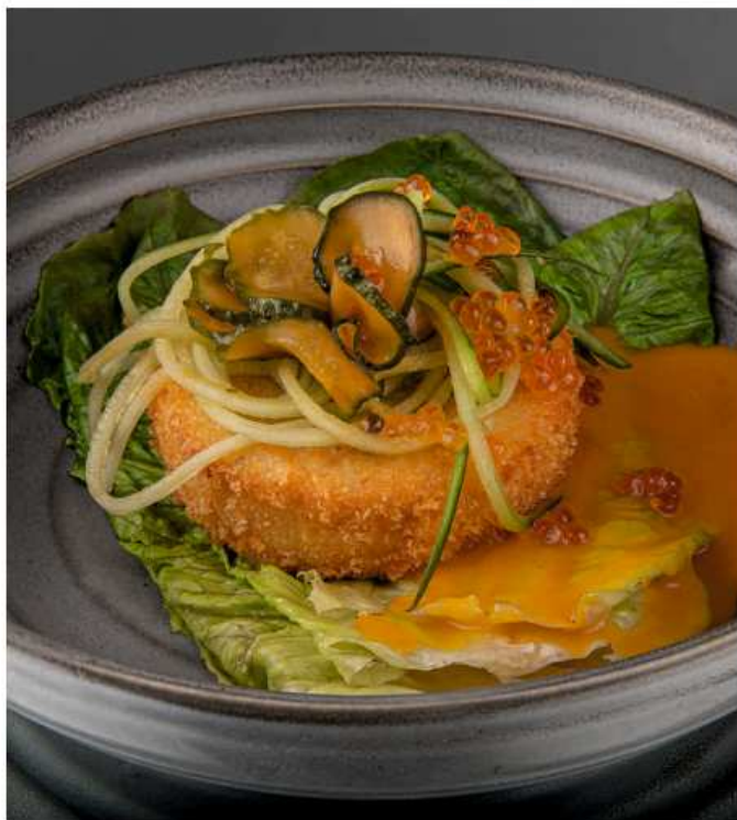
Крабкейк с соусом «Манго чили» котлета из краба, романо, огурец, икра лосося, сливочный чили соус с манго