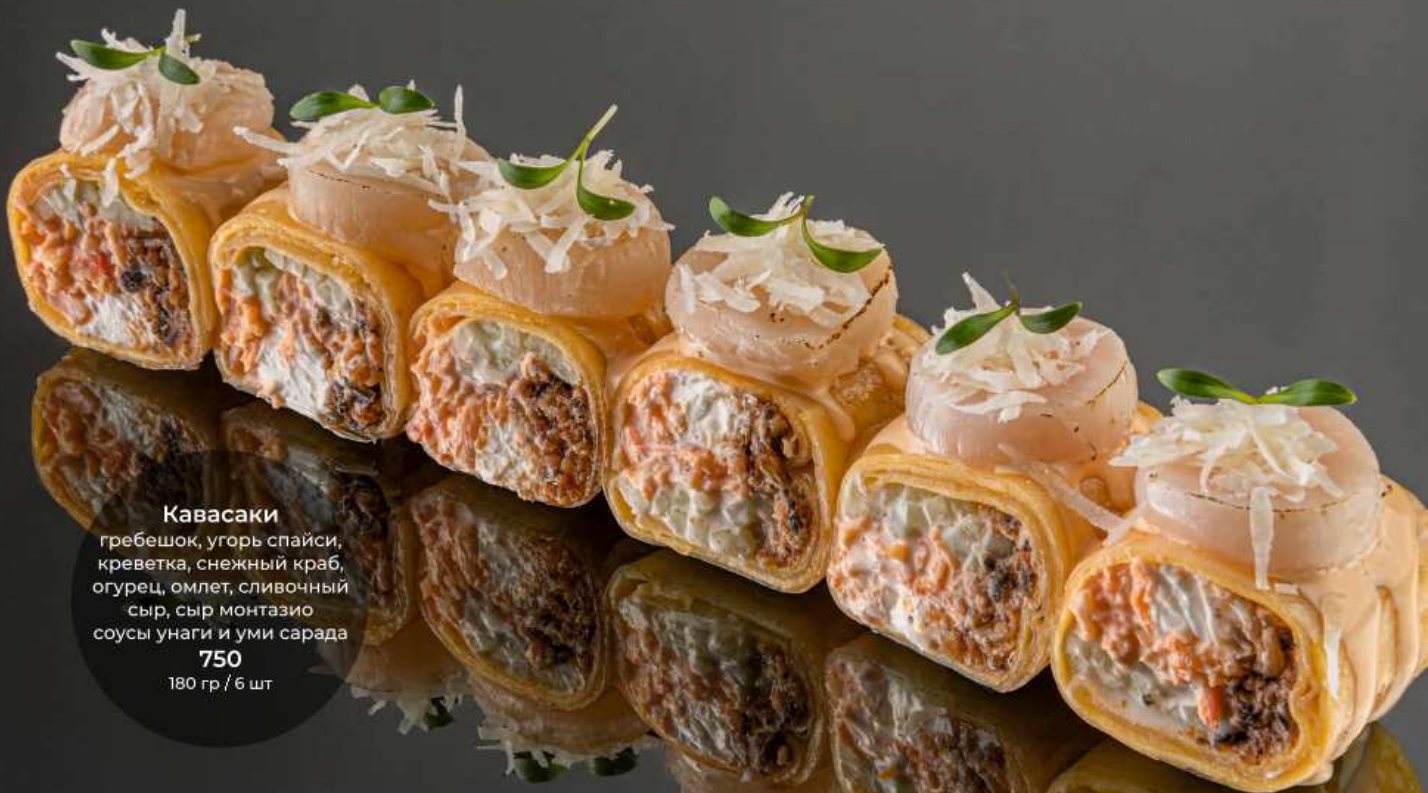
Кавасаки гребешок, угорь спайси, креветка, снежный краб, огурец, омлет, сливочный сыр, сыр монтазио соусы унаги и уми сарада 750 180 гр / 6 шт