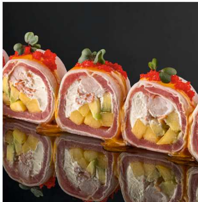
Ёката ролл 190 гр / 5 шт | 750 тунец, креветки, страчателла, дайкон, манго, сливочный сыр, авокадо, тесто харумаки, соусы на основе пюре манго с чили перцем и уми сарада, кра масаго