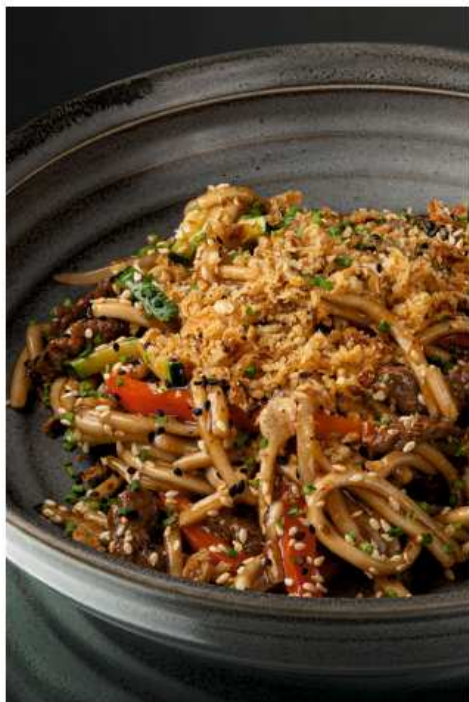
Удон с говядиной и черным перцем 270 гр | 860 цукини, болгарский перец, зеленый лук, заправка на основе черного перца и имбиря