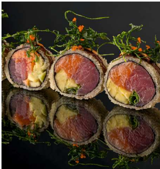
Ролл Юми лосось, тунец, романо, авокадо, соусы спайси и унаги, икра масаго