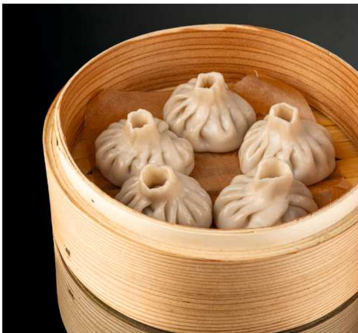
Гедза с курицей в устричном соусе 180 гр / 5 шт 370 Гедза с индейкой, шпинатом и сыром 185 гр / 5 шт 430 Черные гедза с креветкой и кальмаром 210 гр / 5 шт 520