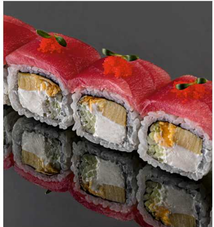
Филадельфия с тунцом 250 гр / 6 шт | 720 тунец, омлет, огурец, картофельные чипсы, икра масаго, сливочный сыр