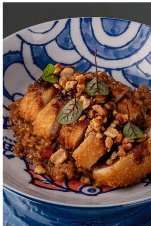
Рис с цыпленком кацу 280 гр | 580 овощи с заправкой на основе креветочного соуса и имбирно-чесночной пасты