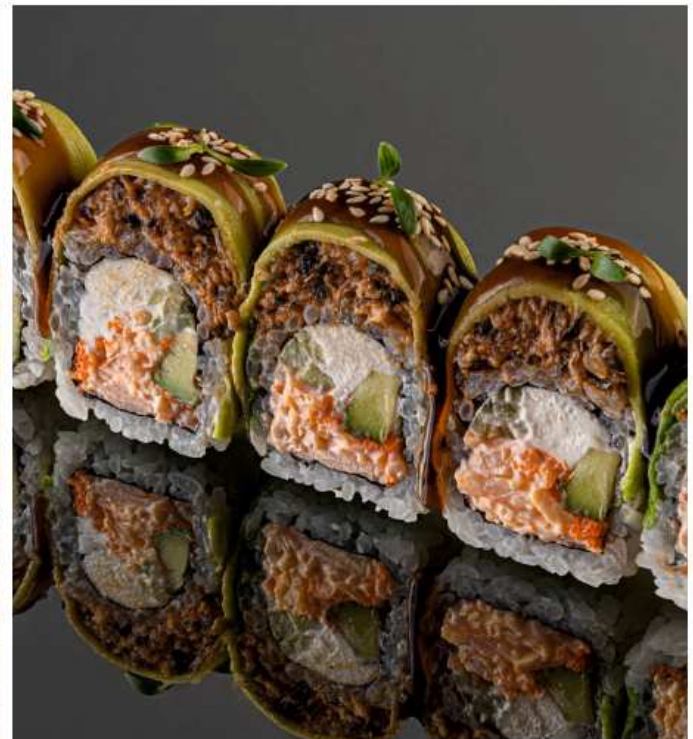
Ролл Окинава спайси угорь, снежный краб, икра масаго, авокадо, огурец, сливочный сыр, соус унаги, кунжут