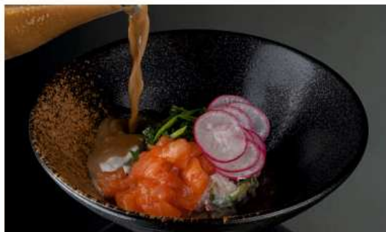
Окрошка с лососем 000 гр | 890