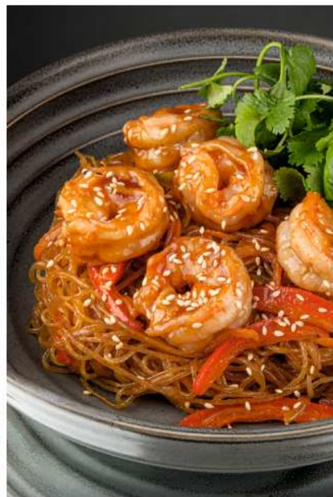
Фунчоza с креветками 380 гр | 780 болгарский перец, цукини, морковь, лук, кунжут, кунжутное масло, соус унаги