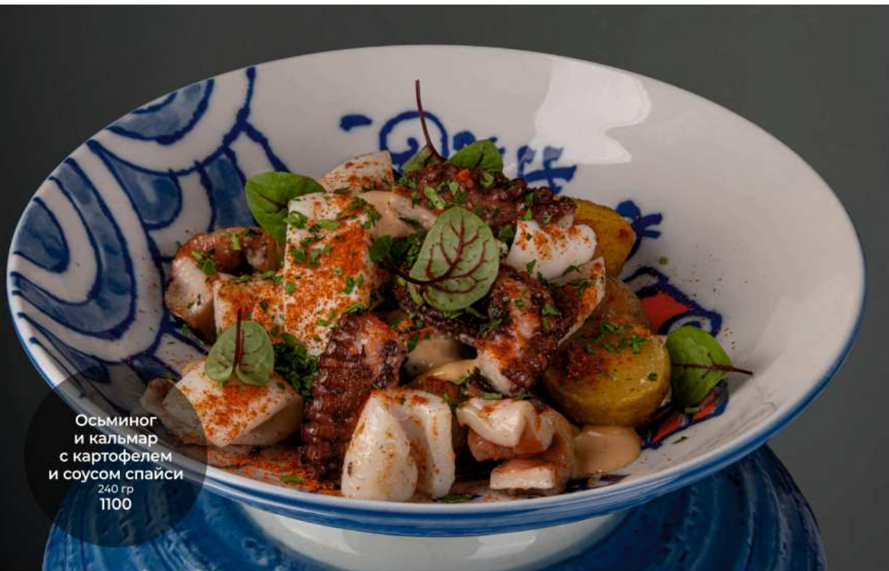
Осьминог и кальмар с картофелем и соусом спайси 240 гр 1100