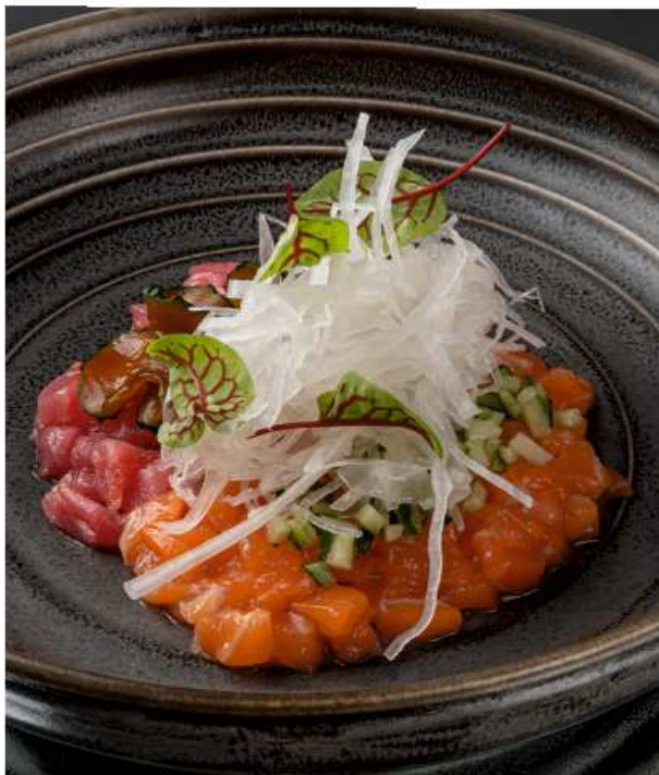
Тартар из лосося и тунца лосось, тунец, соус на основе яичного желтка, каперсов, дижонской горчицы, пюре манго и чили, огурец, дайкон