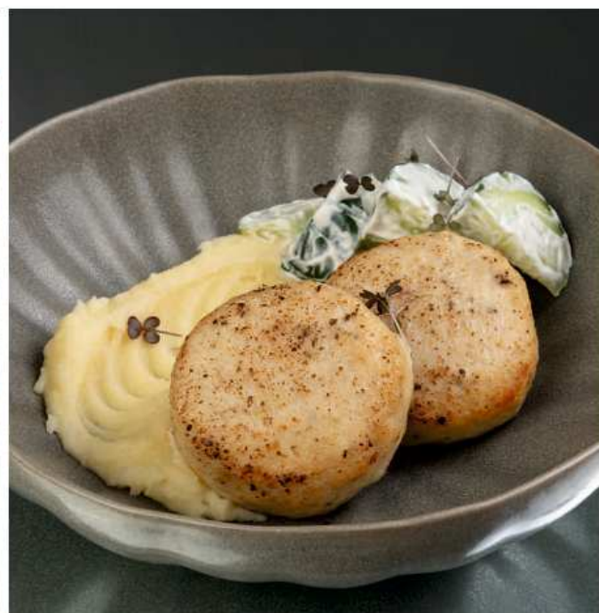
Котлеты из сезонной рыбы с картофельным пюре и салатом из огурцов со сметаной