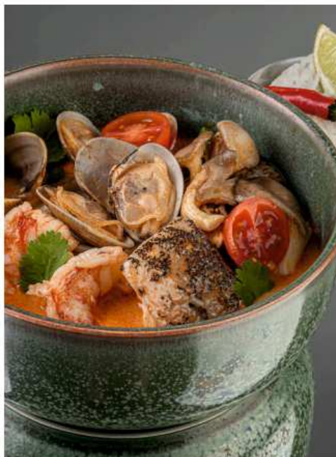
Том ям с морепродуктами 500/70 гр | 850 палтус, лангустины, вонголе, вешенки, черри, рис, лайм, кинза