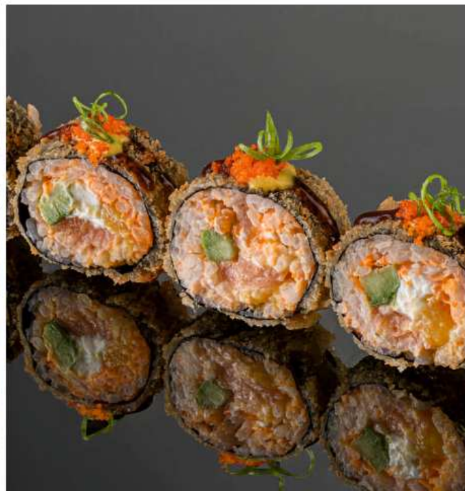
Теплый ролл с лососем и манго снежный краб, сливочный сыр, авокадо, тобико, соусы манго, уми сарада и унаги