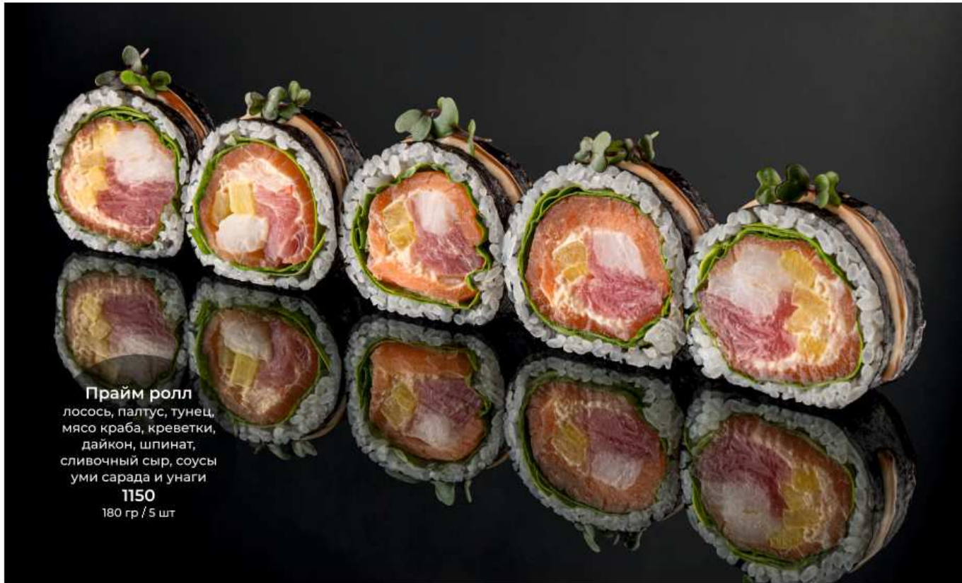
Прайм ролл лосось, палтус, тунец, мясо краба, креветки, дайкон, шпинат, сливочный сыр, соусы уми сарада и унаги 1150 180 гр / 5 шт