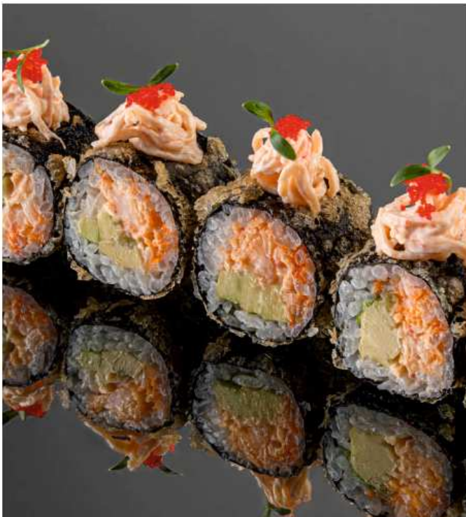
Итальянский ролл снежный краб, авокадо, икра масаго, спайси соус 170 гр / 6 шт | 520