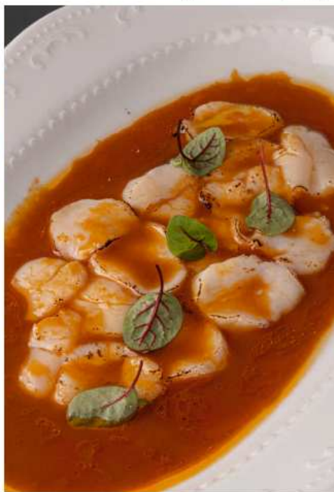
Татаки из гребешка дальневосточного 110 гр | 950 заправка на основе пасты карри, меда, дижонской горчицы и кунжутного масла