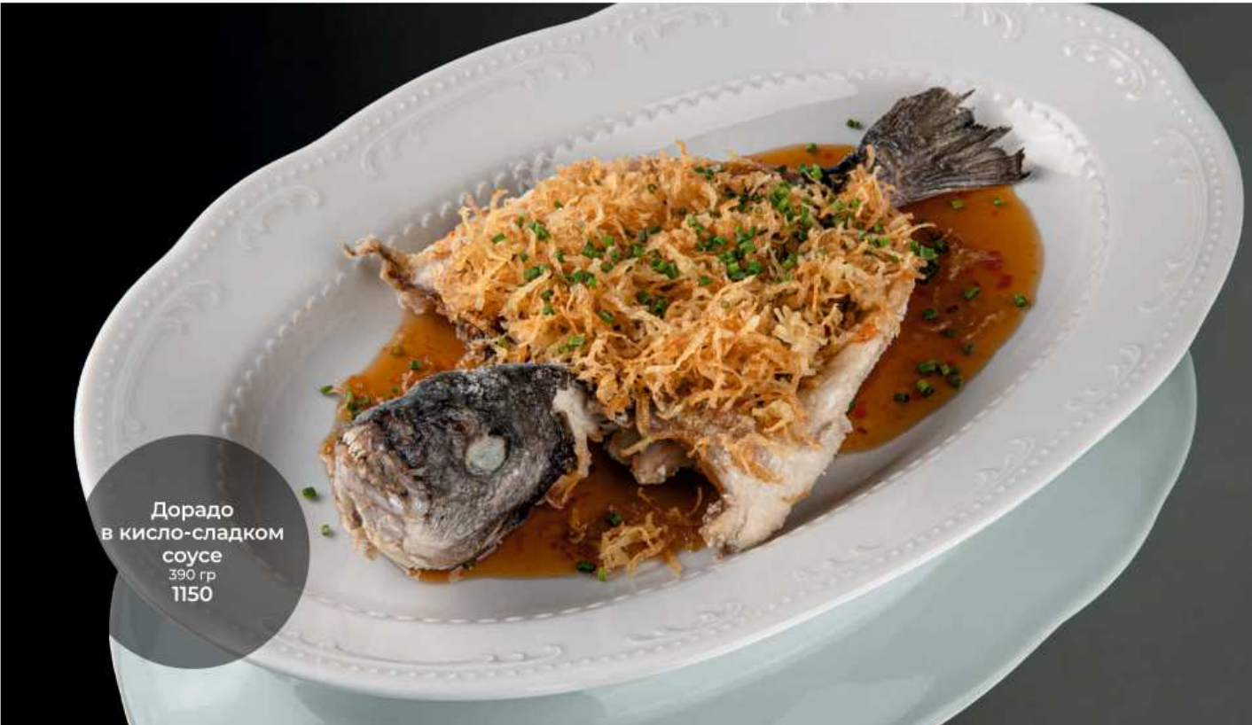
Дорадо в кисло-сладком соусе 390 гр 1150