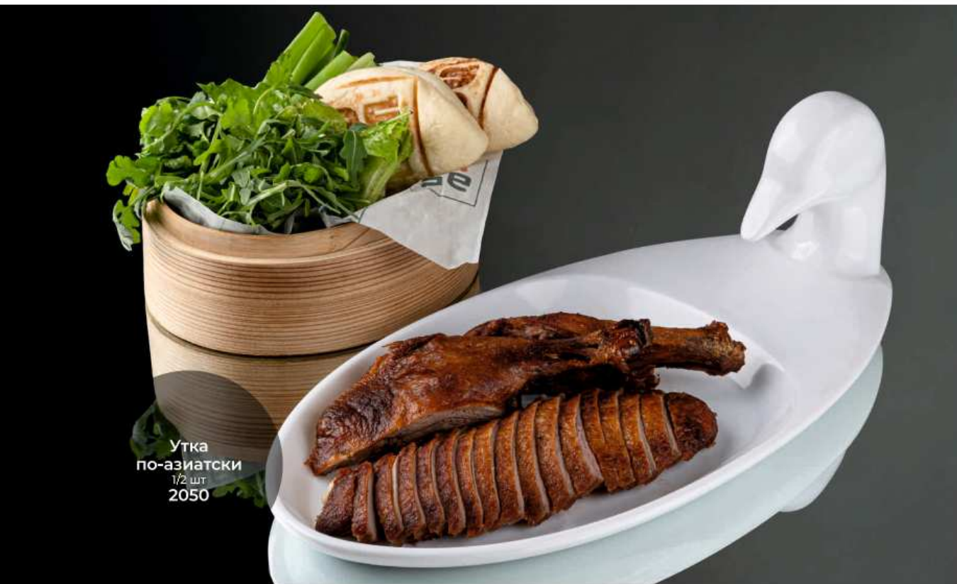
Утка по-азиатски 1/2 шт 2050