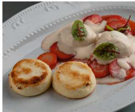
Сырники 290 гр | 550 с сезонной ягодой и мороженым мисо