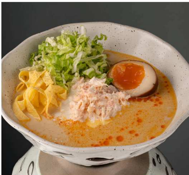
Сырный рамен с крабом 540 гр | 950 сырный бульон, креветки, краб, лапша удон, омлет, пекинская капуста, страчателла, маринованное яйцо