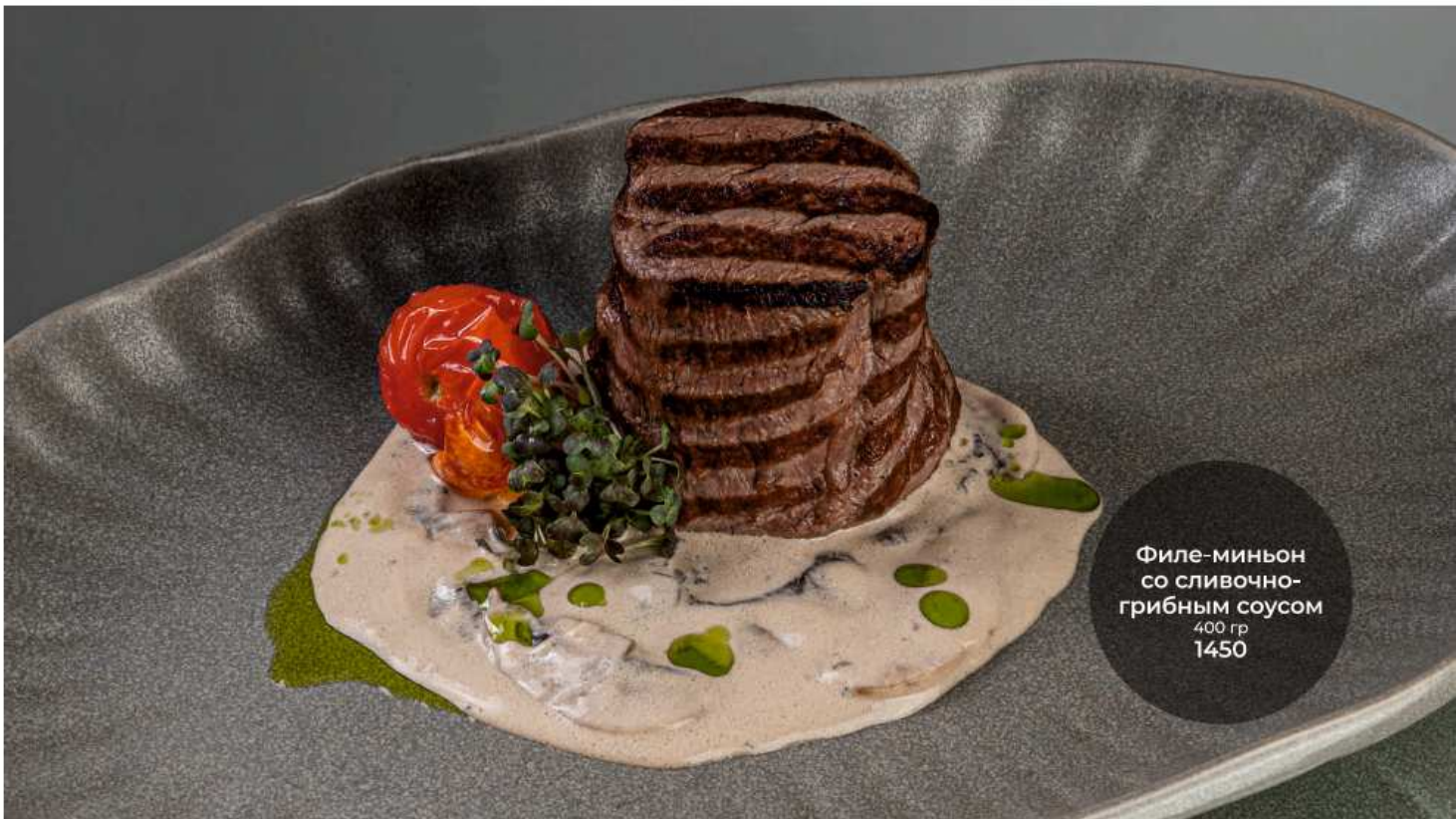
Филе-миньон со сливочно- грибным соусом 400 гр 1450