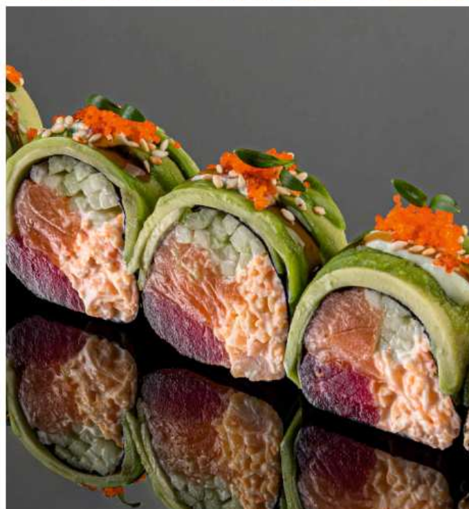
Ролл с сашими из тунца и лосося 170 гр / 6 шт | 880 тунец, лосось, авокадо, огурец, икра масаго, соусы уми сарада и унаги