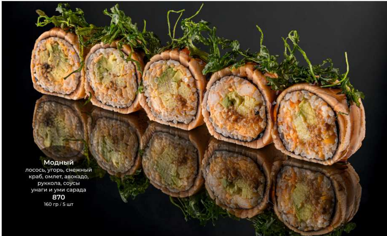
Модный лосось, угорь, снежный краб, омлет, авокадо, руккола, соусы унаги и уми сарада 870 160 гр / 5 шт