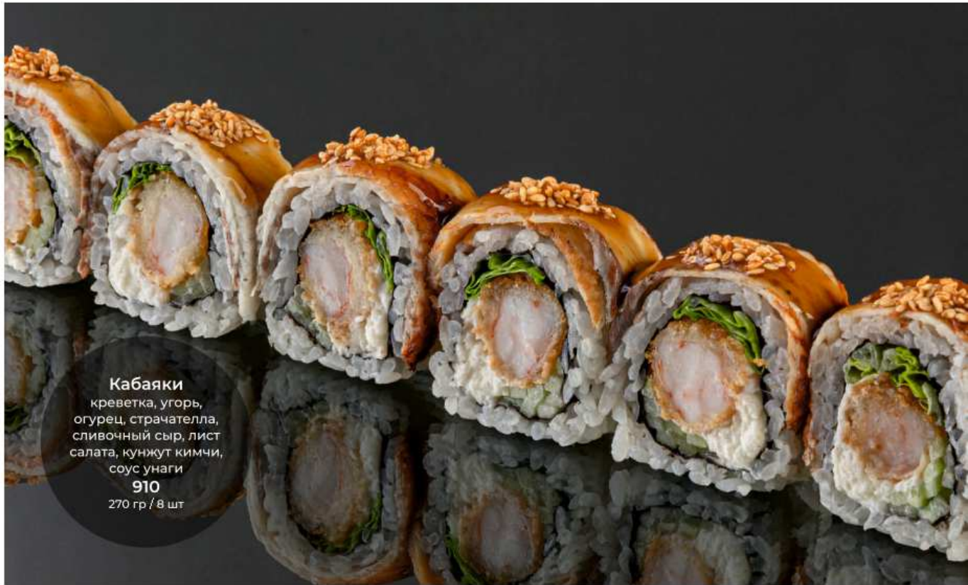
Кабаяки креветка, угорь, огурец, страчателла, сливочный сыр, лист салата, кунжут кимчи, соус унаги 910 270 гр / 8 шт