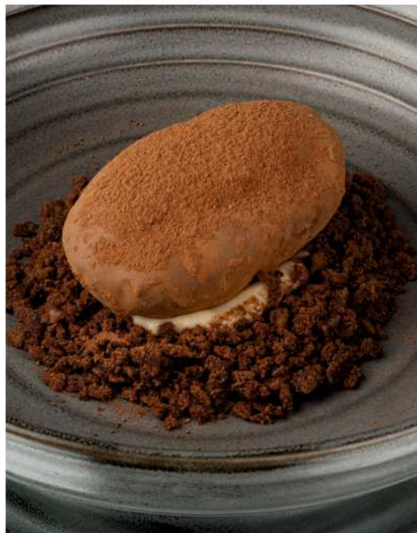
Пирожное «Картошка» 140 гр | 450

бисквитная крошка, шоколадная глазурь, начинка на основе творожного сыра, молочного шоколада, грецкого ореха и сгущенного молока