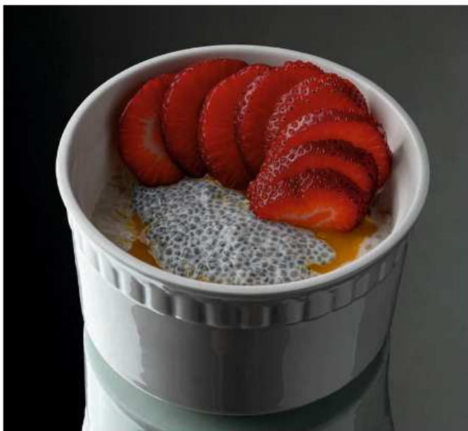
Рисовая каша на кокосовом молоке 320 гр | 540 с семенами чиа и сезонной ягодой