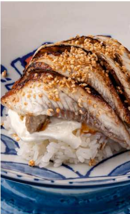
Поке с угрем 230 гр | 790 баклажаны, страчателла, соус на основе унаги и тайского чили