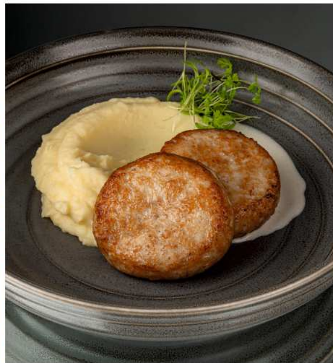
Домашние куриные котлеты с картофельным пюре и сливочным соусом