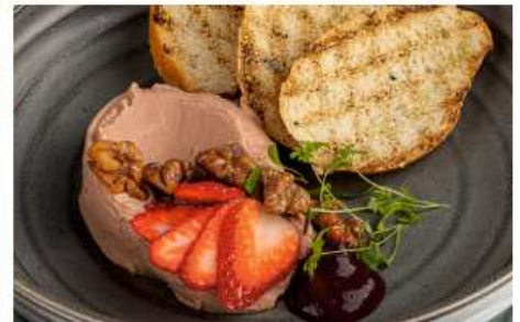
Паштет из куриной печени с гренками 170 гр | 480