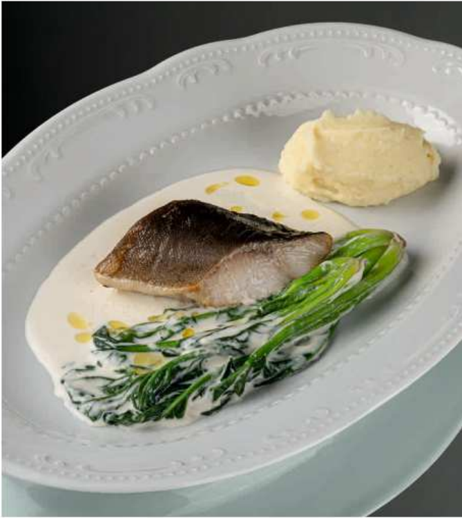
Палтус со шпинатом картофельным пюре и сливочным соусом