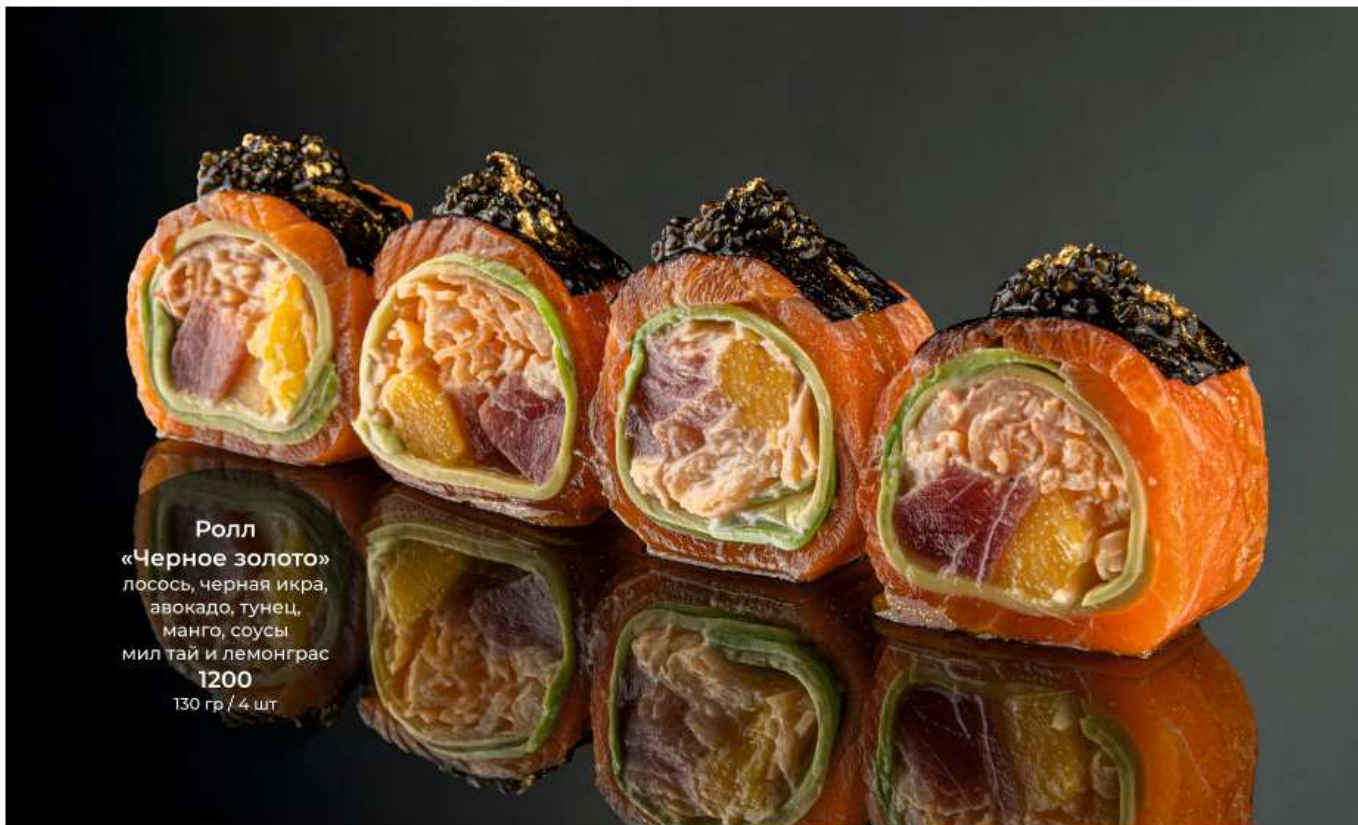
Ролл «Черное золото» лосось, черная икра, авокадо, тунец, манго, соусы мил тай и лемонграс 1200 130 гр / 4 шт