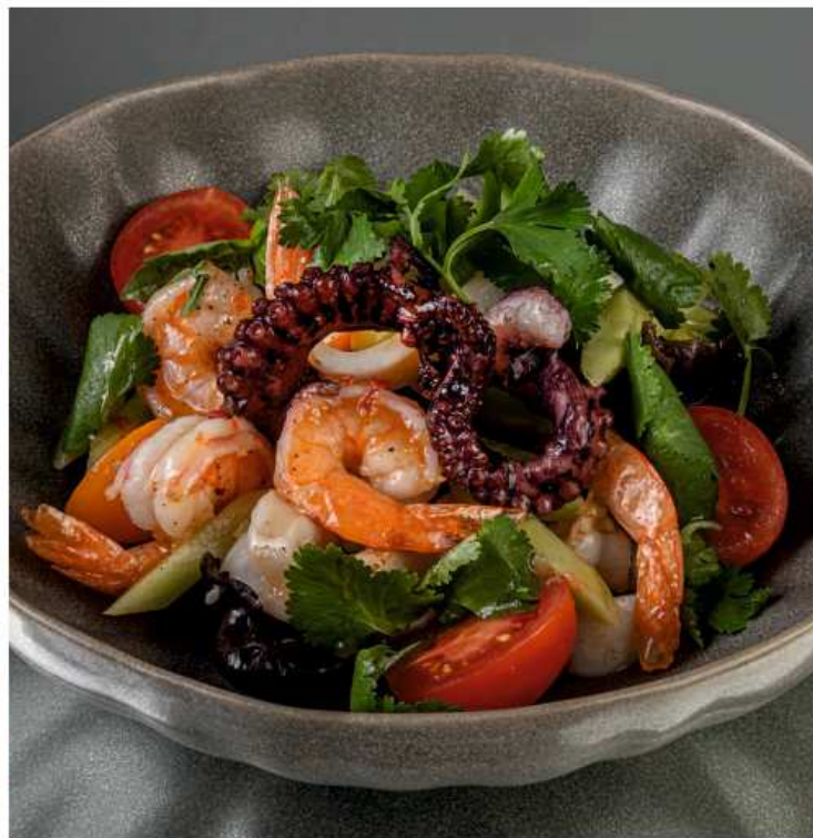
Салат с морепродуктами и осьминогом 240 гр | 1050 креветка, кальмар, осьминог, огурец, томаты черри, кинза, петрушка, заправка на основе оливкового масла, дижонской горчицы и тайского чили