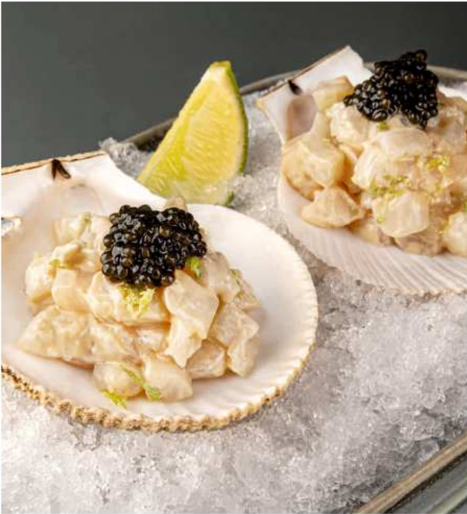
Тартар из гребешка с черной икрой 110 гр | 1150 гребешок, соус на основе сливок и чили соуса, лайм, черная икра