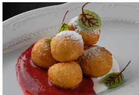
Творожные пончики 340 гр | 550 с малиновым кули и сметаной