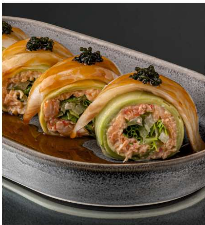
Ролл с сашими из палтуса и краба 160 гр / 6 шт | 1050 палтус, мясо краба, креветки, авокадо, салат романо, морской виноград, соус лемонграс