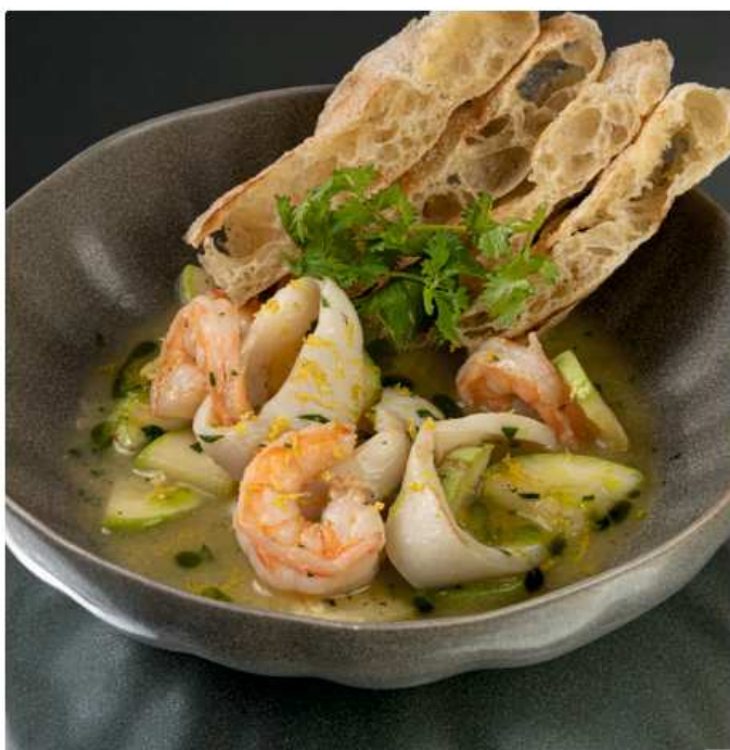
Креветки и кальмары в оливково-чесночном соусе с лепешкой фокаччо