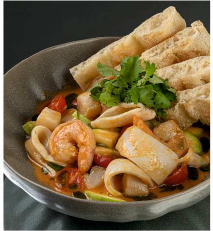
Гребешки, кальмары и креветки с цукини в соусе «Том ям»