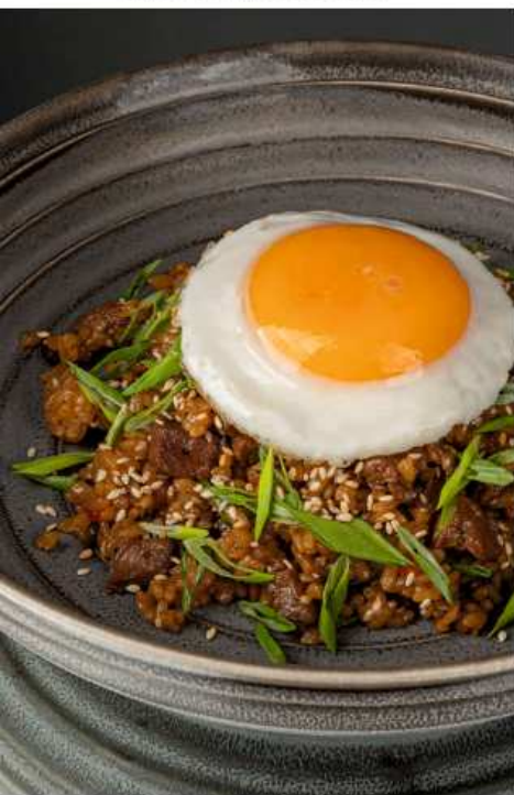
Японский жареный рис с говядиной 310 гр | 750 яйцо куриное, шампиньоны, соусы креветочный и имбирно-чесночный