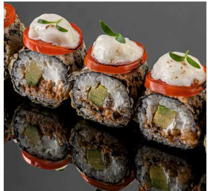
Теплый ролл с угрем угорь, страчателла, авокадо, сливочный сыр, черри, соусы уми сарада и унаги 220 гр / 6 шт | 610