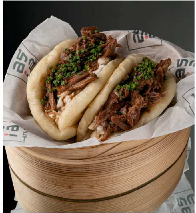
Бао с уткой конфи, страчателлой и соусом демигласс 260 гр | 590