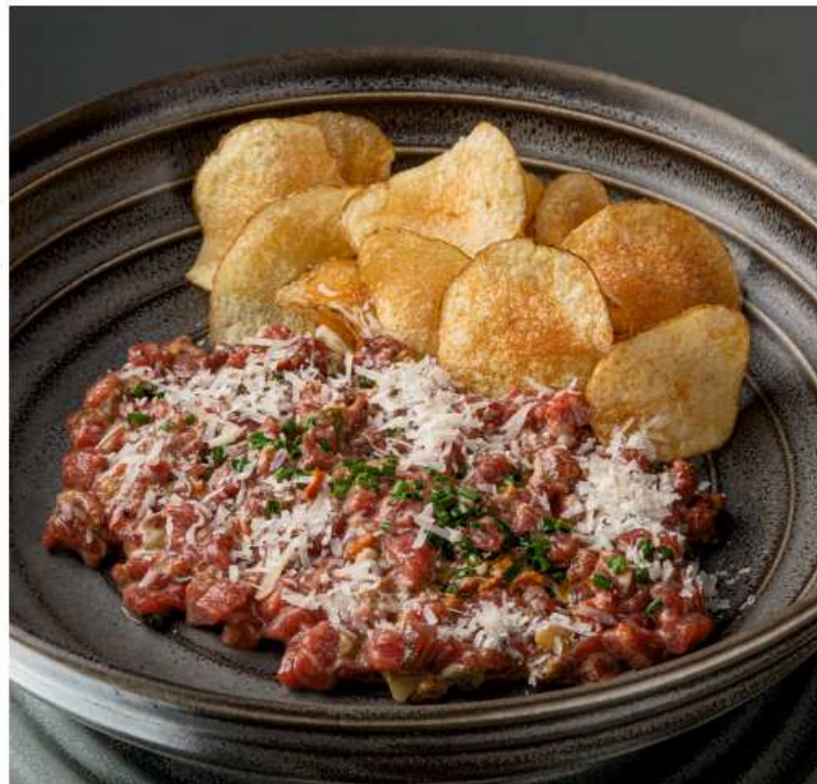
Тартар из говядины с трюфельным маслом говядина, маринованный огурец, вяленые томаты, каперсы, соус на основе оливкового масла, яичного желтка и дижонской горчицы, картофельные чипсы, сыр пармезан