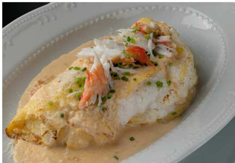
Омлет с камчатским крабом, 350 гр | 1550 страчателлой, трюфельным ароматом и пармезаном