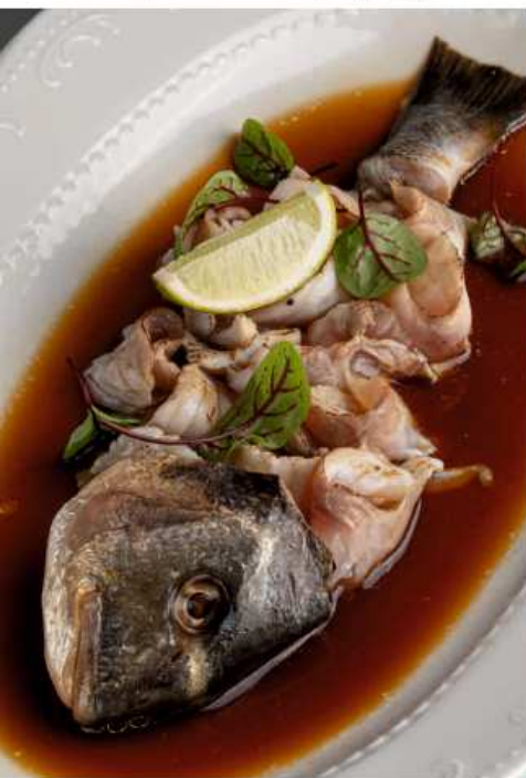
Татаки из дорадо 200 гр | 1050 креветочный соус, соус на основе цитрусовых, оливковое масло