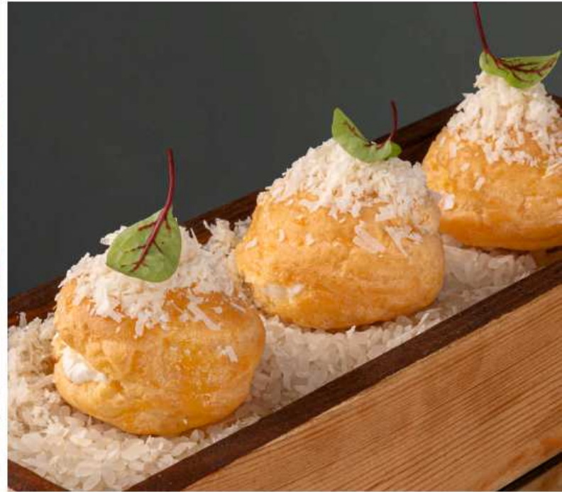
Гужеры с креветкой и трюфельным ароматом 90 гр | 450 гужеры из заварного теста, креветки, сливочный сыр, майонез, пармезан, трюфельное масло