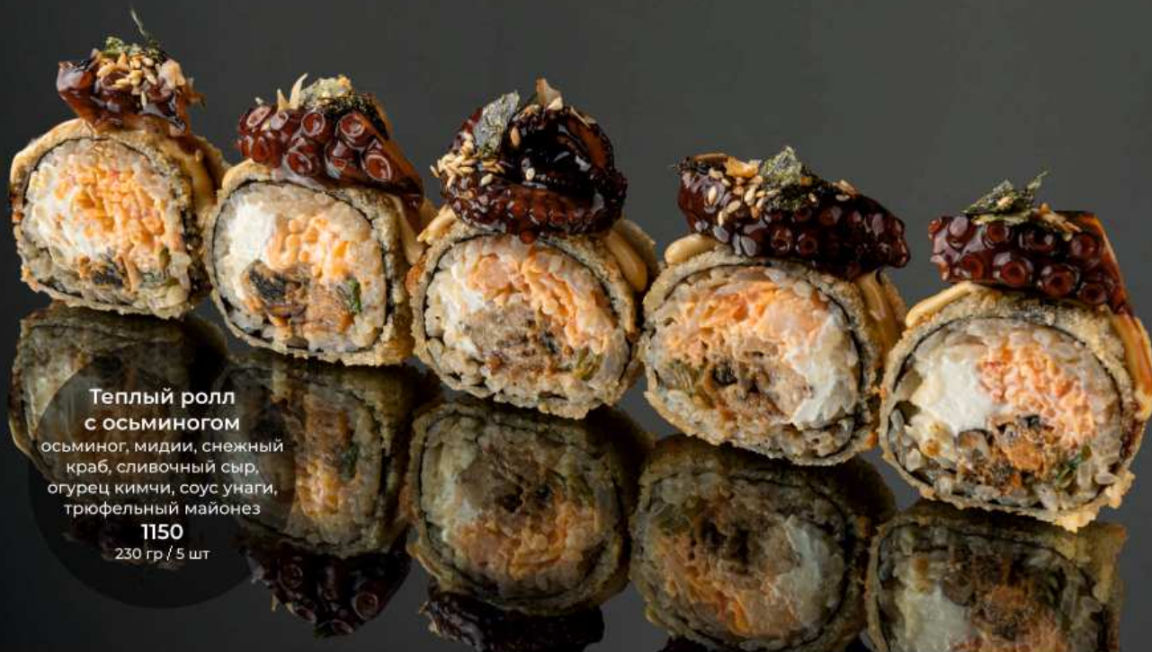
Теплый ролл с осьминогом осьминог, мидии, снежный краб, сливочный сыр, огурец кимчи, соус унаги, трюфельный майонез 1150 230 гр / 5 шт

СПЕЦИИ | Имбирь - 50 | Васаби - 30 | Соевый соус - 40 | Соус понзу - 50