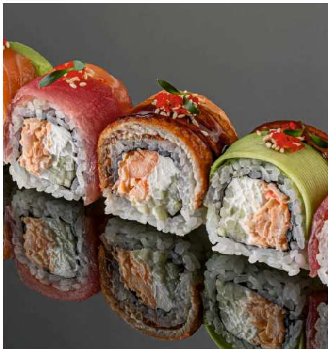
Радуга 240 гр / 6 шт | 820 лосось, угорь, тунец, снежный краб, огурец, авокадо, икра масаго, сливочный сыр, соус унаги