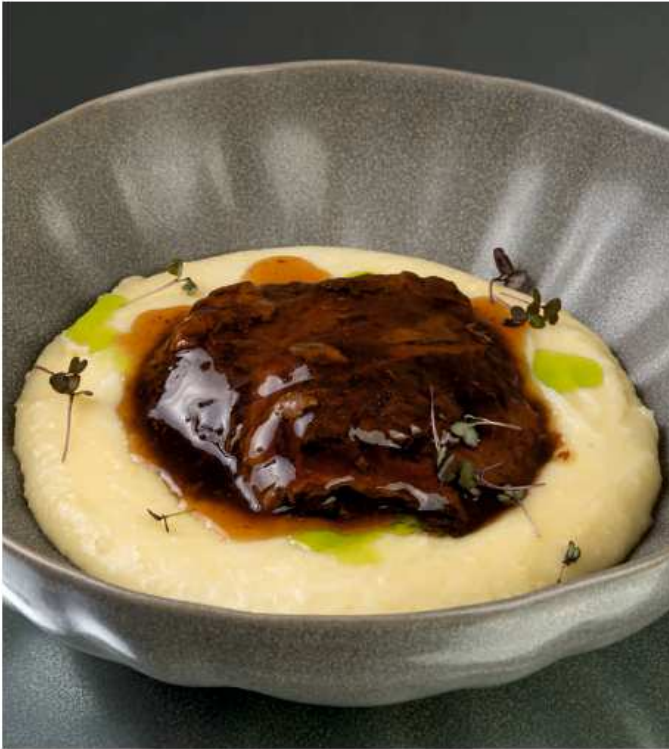
Телячья щековина с сырно-картофельным пюре