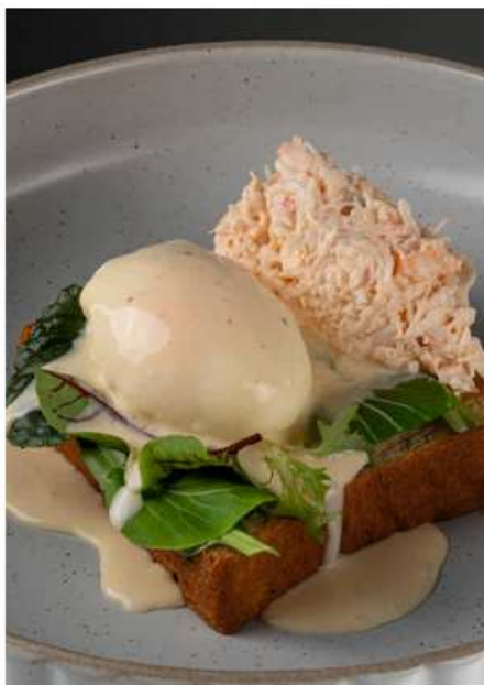
Бенедикт с крабом, 250 гр | 1100 соусом голландез, креветками и миксом салатных листьев