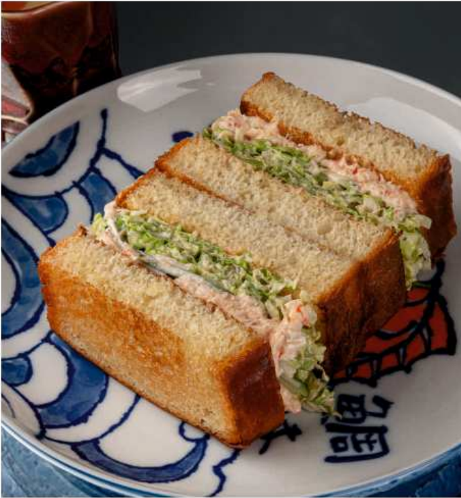
Сендвич с крабом 220/100 гр | 870 Сендвич с телячьей щековиной 210/100 гр | 790