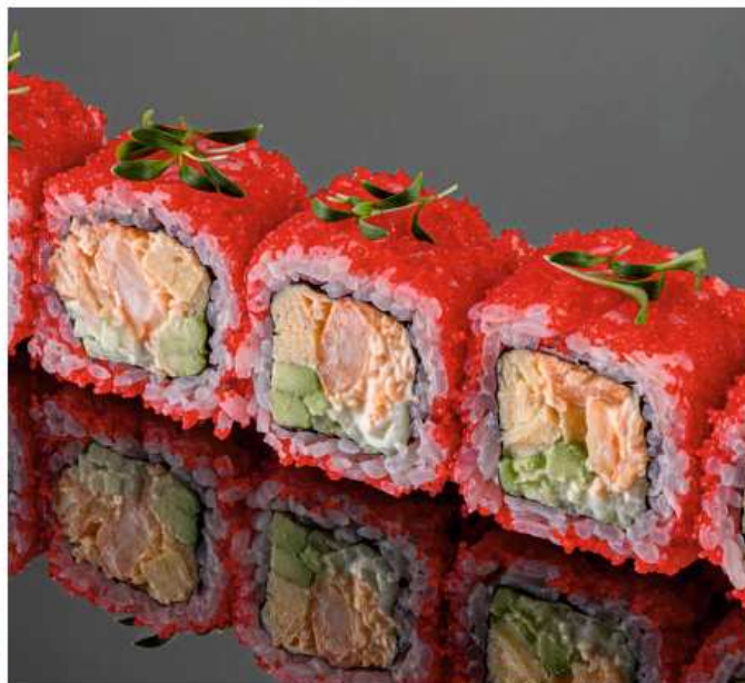
Калифорния с крабом 230 гр / 6 шт | 880 мясо краба, креветки, авокадо, огурец, икра масаго, омлет