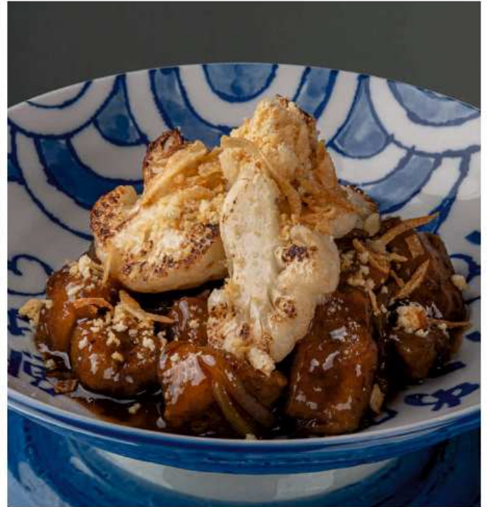
Карамелизированная баранина с цветной капустой и печеньем из пармезана