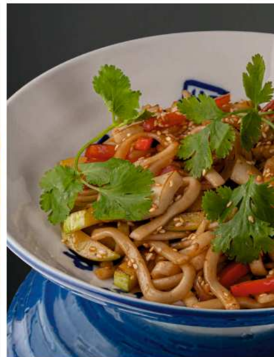
Удон с кальмаром в устричном соусе 310 гр | 650 болгарский перец, цукини, лук, кинза, кунжут