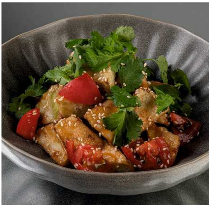
Салат с хрустящими баклажанами, томатами и кинзой 220 гр | 490 соус чили, соус унаги, кунжут