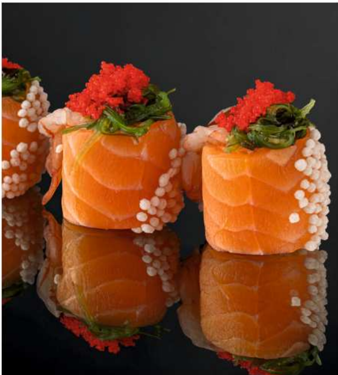
Шиодзуки лосось, лангустины, кайса, рисовые шарики, икра масаго, сливочный сыр, соус уми сарада