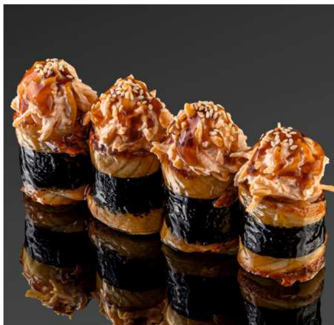
Норито с крабом 115 гр / 4 шт | 850 угорь, мясо краба, креветки, кунжут, соус унаги