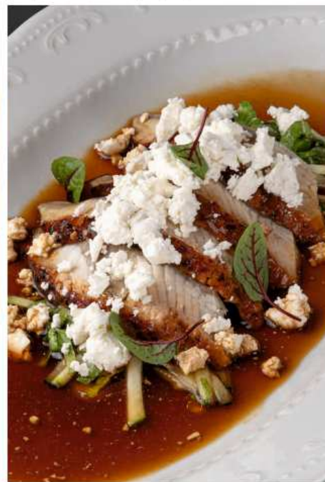
Татаки из угря 200 гр | 860 угорь, микс салатных листьев, огурец, соус на основе оливкового масла, дижонской горчицы и цитрусовых