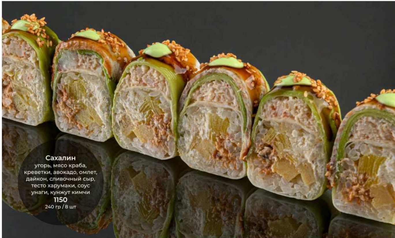
Сахалин угорь, мясо краба, креветки, авокадо, омлет, дайкон, сливочный сыр, тесто харумаки, соус унаги, кунжут кимчи 1150 240 гр / 8 шт