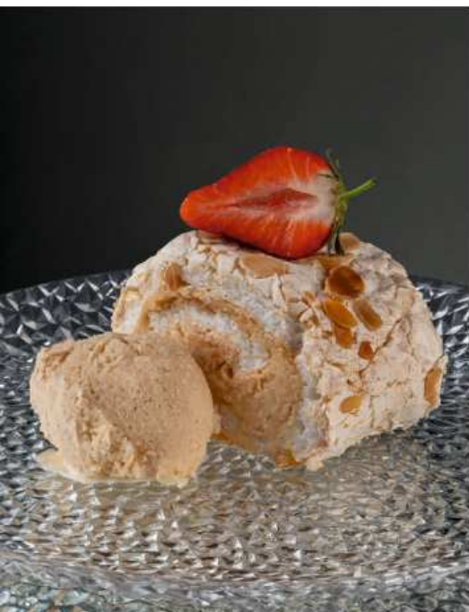
Меренговый рулет 100/30:10 гр | 370 с мороженым мисо

бисквитная крошка, шоколадная глазурь, начинка на основе творожного сыра, молочного шоколада, грецкого ореха и сгущенного молока