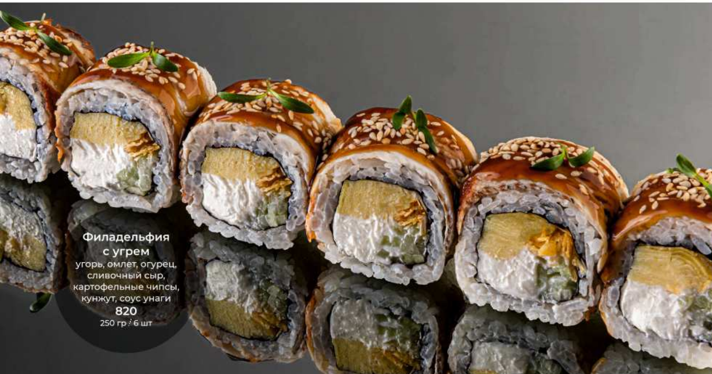
Филадельфия с угрем угорь, омлет, огурец, сливочный сыр, картофельные чипсы, кунжут, соус унаги 820 250 гр / 6 шт

СПЕЦИИ | Имбирь - 50 | Васаби - 30 | Соевый соус - 40 | Соус понзу - 50