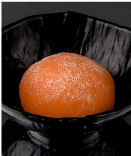
Моти с клубникой 65 гр | 300

начинка на основе сыра маскарпоне, йогурта, сливок и клубники