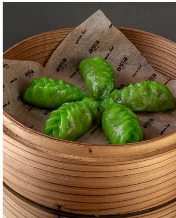
Дим-самы с гребешком и кальмаром 175 гр / 5 шт 650