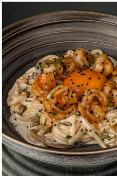
Сливочный удон с креветками 350 гр | 890 вешенки, страчателла, яичный желток, пармезан