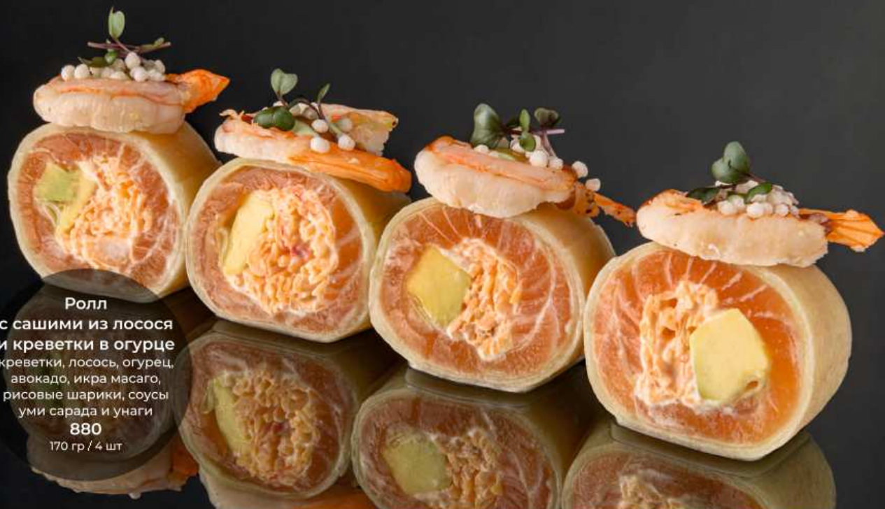
Ролл с сашими из лосося и креветки в огурце креветки, лосось, огурец, авокадо, икра масаго, рисовые шарики, соусы уми сарада и унаги 880 170 гр / 4 шт