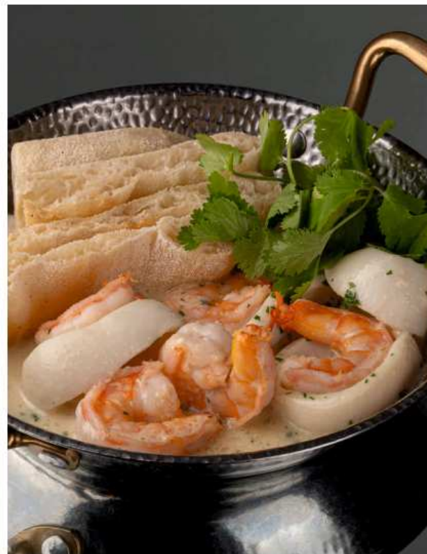
Креветки и кальмары в сливочном соусе