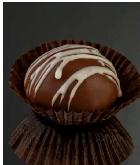
Сырная конфета 25 гр | 150

с соленой карамелью начинка на основе сыра маскарпоне, йогурта, сливок и соленой карамели